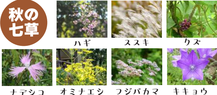
ハギ ススキ リズ ナデシコ オミナエシ フジバカマ キキョウ