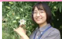
IP(自然)スタッフ はなびちゃん

「七草」と聞くと、1月7日に食べる春の七草粥を思い出す方が多いかもしれません。実は、秋にも「七草」があるのをご存じでしょうか？